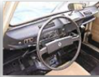
Planche de bord en 1976