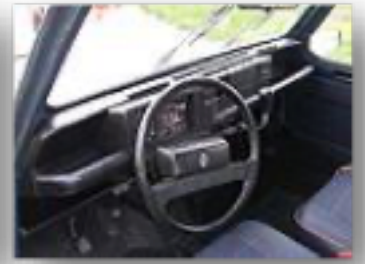
Planche de bord en 1983