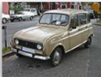
Calandre en 1983