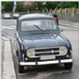
Calandre en 1968

Arrêt de la fabrication de la Renault 4L