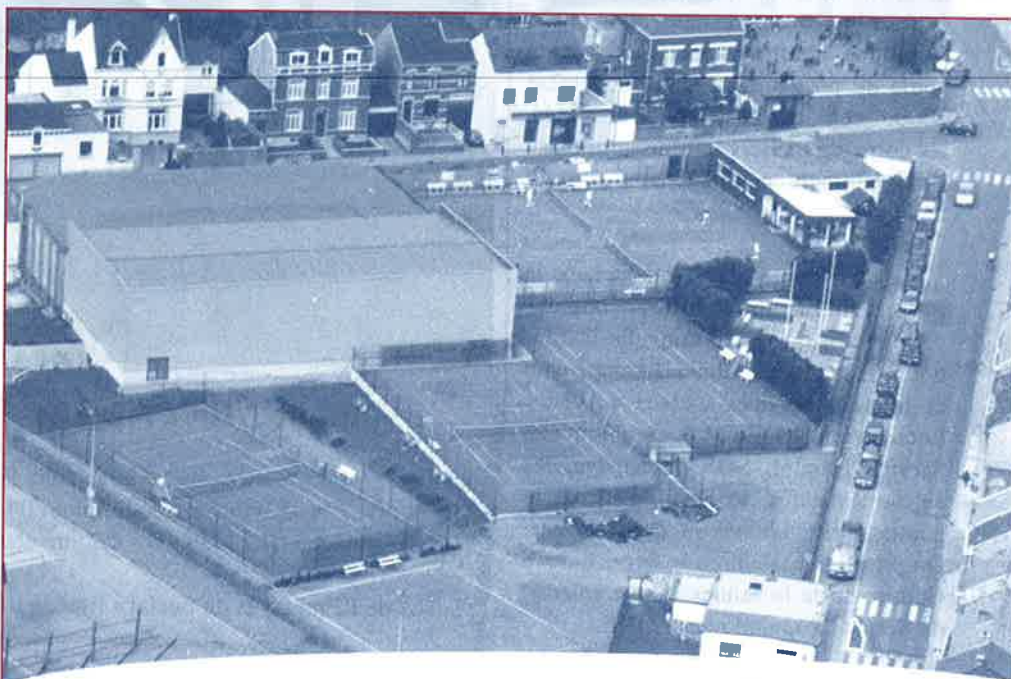
Vue aérienne du club.

On encadre énormément les équipes de jeunes pour arriver à de bons résultats, remporter des tournois. Il y a 7 équipes de jeunes. Actuellement, on compte 90 inscriptions de jeunes aux cours de préparation aux interclubs. Les cours sont gratuits ou à des prix très démocratiques.