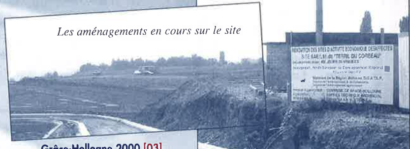
Les aménagements en cours sur le site

L'espace Corbeau est destiné à devenir un des endroits de convivialité de Grâce-Hollogne.