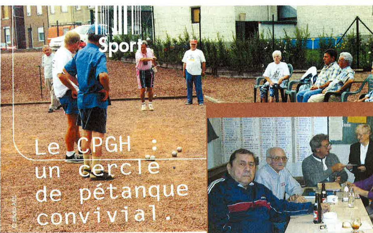
Le Comité en réunion.