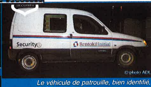
Le véhicule de patrouille, bien identifié.

Initial GMIC Security veille sur le zoning